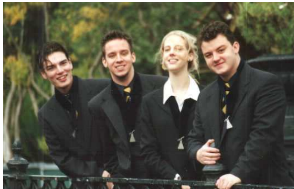
CDL: stem op mij voor dansend haar!